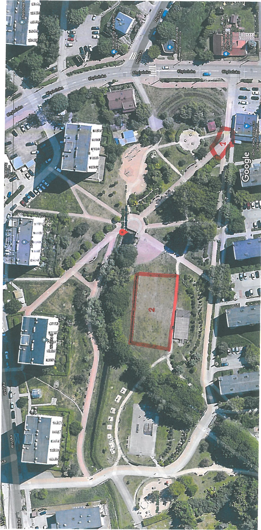
10 m

1 ustawienie iluminacji świetlnej w formie bramy – na wejściu do parku od strony ul. Chylońskiej – bliski dostęp do skrynek elektrycznej czmej.