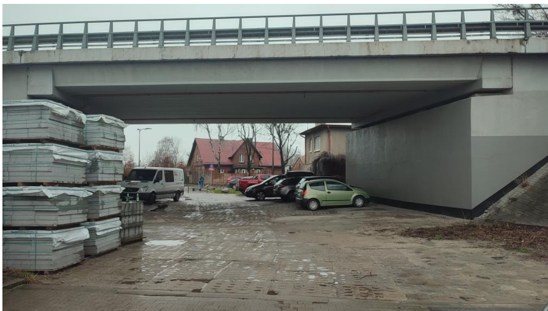
Rysunek 2 - stan istniejący