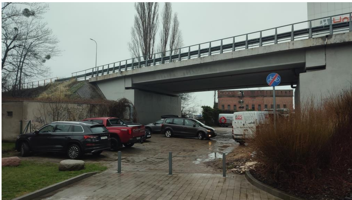
Rysunek 1 - stan istniejący ( z frontu widać zakończenie obecnego ciągu pieszo-rowerowego od strony ulicy Węglowej), pod wiaduktem znajduje się dziki parking, odpadki i poklawiszowana stara nawierzchnia