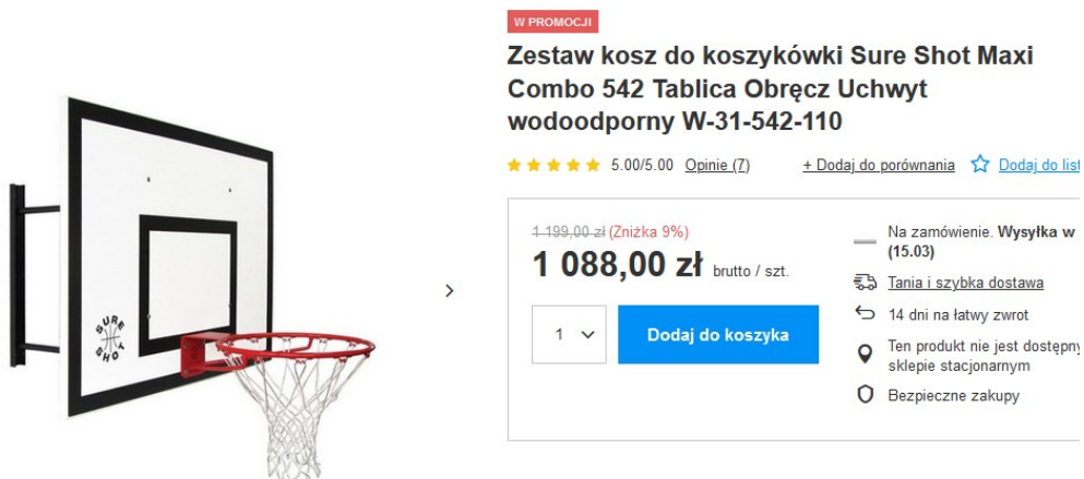
Rysunek 4 - przykładowa oferta cenowa ze sklepu internetowego